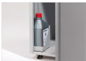
SYSTÉM AUTOMATICKÉHO MAZÁNÍ

Dva vstupní otvory a dvě sady řezných nožů pro samostatné vkládání a skartování papíru a CD/DVD/kreditních karet. Dvě integrované a vyjímatelné odpadní nádoby pro oddělení skartovaného papíru od plastových útržků.