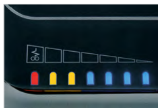
EPC: ELEKTRONICKÉ ŘÍZENÍ VÝKONU

Zobrazuje zátěž při skartování potřebnou k optimalizaci skartování bez záseků papíru.