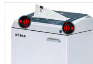
SYSTÉM DETEKCE KOVŮ SHRED GUARD

Automatické mazání eliminuje potřebu ručního mazání jednotky. Nejen, že chrání nože antikorozičními prostředky, ale zajišťuje maximální spolehlivost, účinnost a kapacitu.