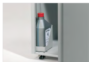
INTEGROVANÝ SYSTÉM AUTOMATICKÉHO MAZÁNÍ

Super silný systém s ocelovými převody, které nabízejí spolehlivost a odolnost proti opotřebení.