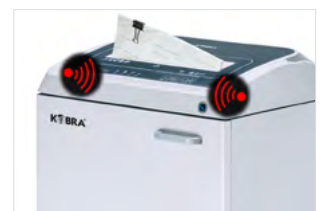
SYSTÉM DETEKCE KOVŮ SHRED GUARD

Systém Shred Guard zastaví stroj, když jsou náhodně vloženy velké kovové předměty. Osvětlený optický indikátor varuje obsluhu, aby tyto předměty odstranila a nože byly chráněny.